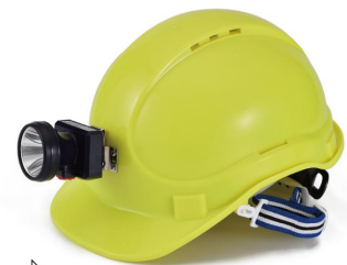
Available with LED Light