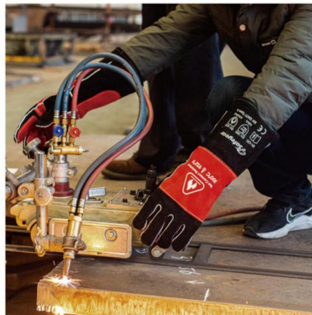
✓ Heavy Duty Quality