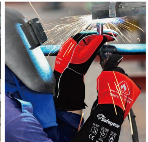
✓ Heat Resistant